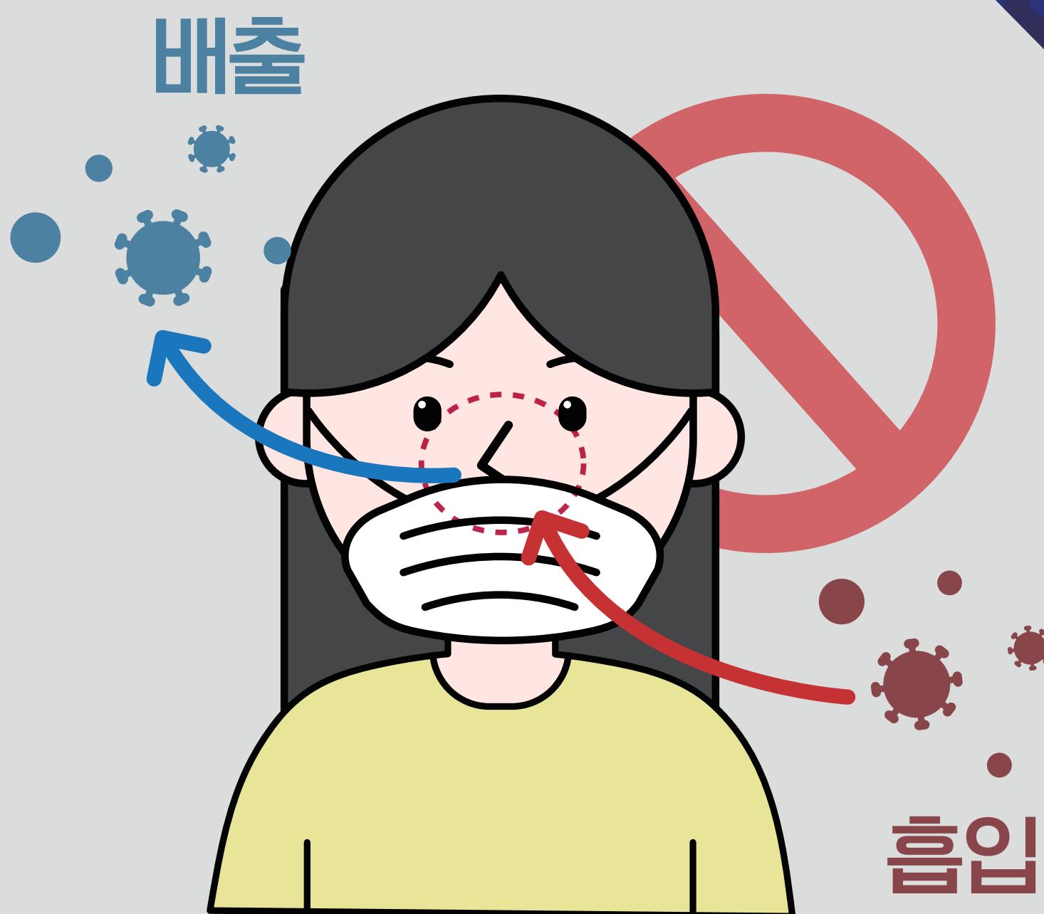
① 코가 노출되는 마스크 착용