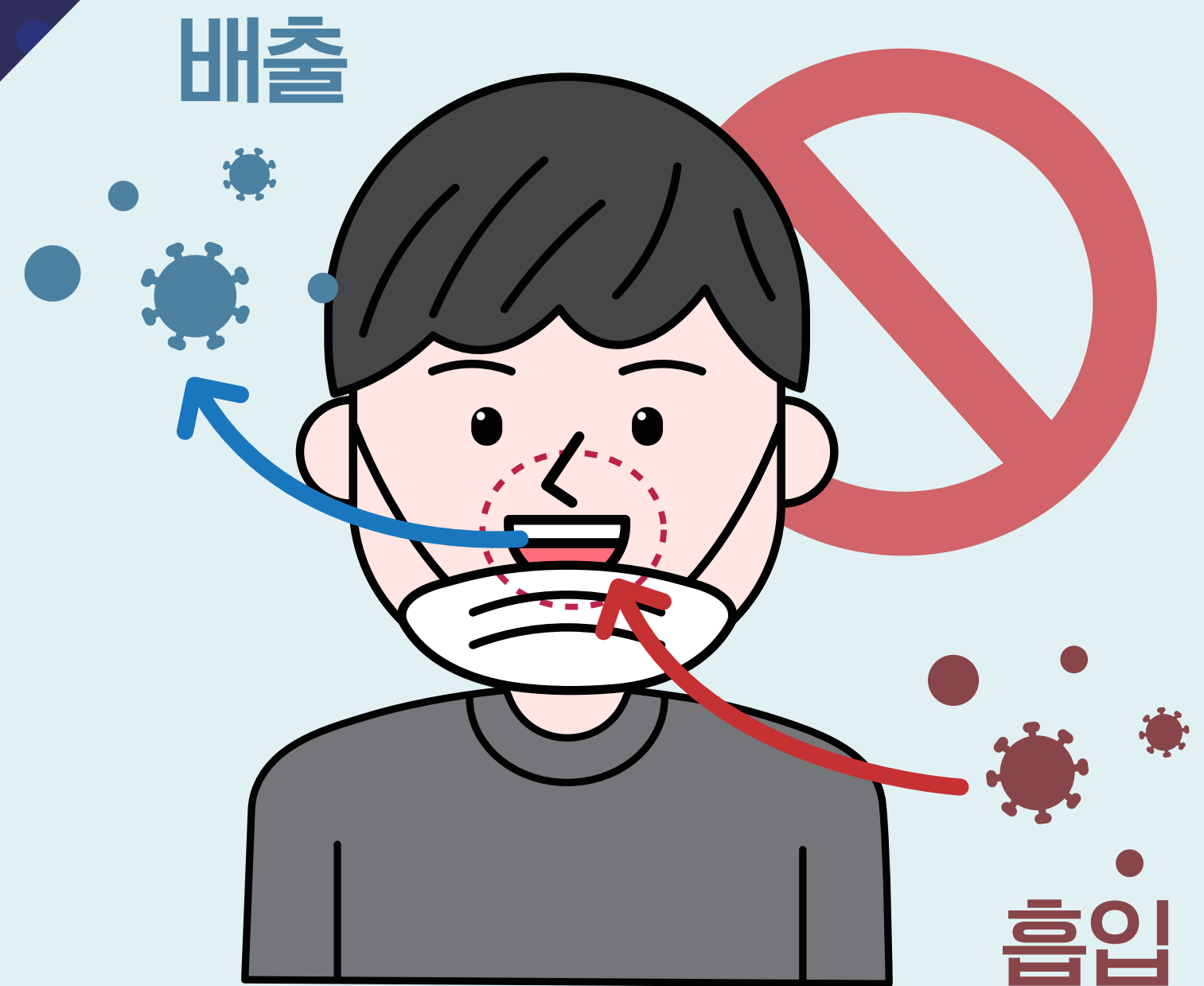
② 턱에 걸치는 마스크 착용